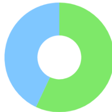
Достижение целевых значений